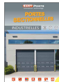
BROCHURE PORTES INDUSTRIELLES