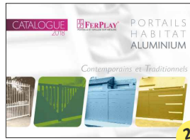
CATALOGUE PORTAILS HABITAT