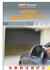
BROCHURE PORTES RESIDENTIELLES