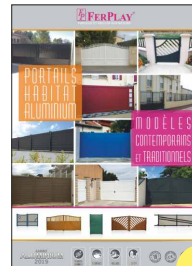
BROCHURE PORTAILS HABITAT