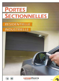
CATALOGUE PORTES SECTIONNELLES