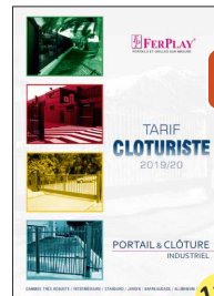
TARIF INDUSTRIEL / CLOTURISTE